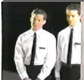
Мормонски мисионери - снимки от Интернет.